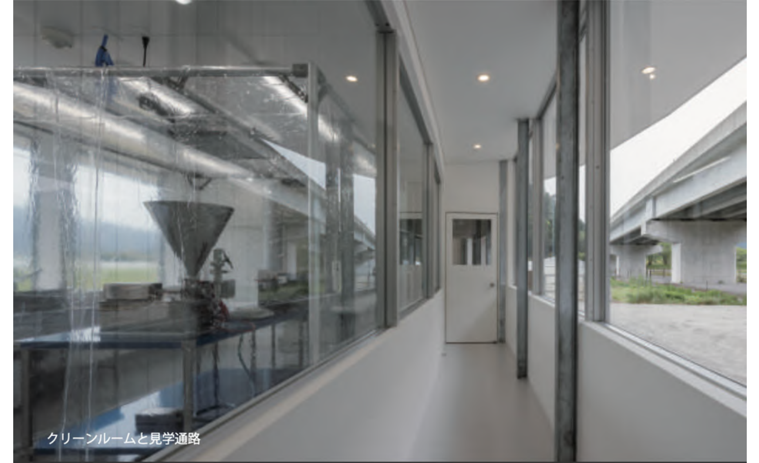
クリーンルームと見学通路