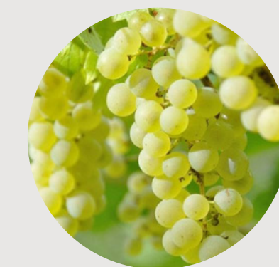
chronoshardi(ブドウ果実エキス)

抗炎症効果や血液循環作用をもつメディカルハーブとして古来より使用されているキク科・アルニカ花から抽出したエキス。脂肪細胞を増やす働きを持ち、脂肪層をボリュームアップさせ、肌のハリと弾力の向上によりプルン肌へと導きます。皮下脂肪細胞増殖、ボリュームアップ作用