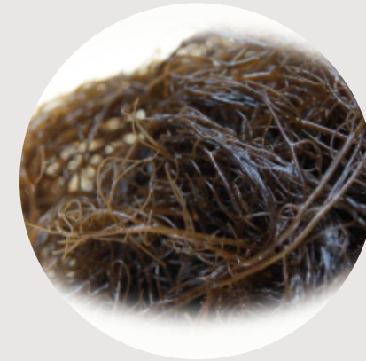
fucoidan(クラドシホンノバエカレドニアエ多糖体)

トンガ王国産の天然モズクから抽出した高純度フコイダンです。硫酸基結合を13%以上、平均分子量170万の高分子で、高い保湿性と高粘性があり皮膚や毛髪にしっかりと多くの水分を貯蔵する力があります。お肌や毛髪表面に潤いのベールを形成し、保湿感とハリ感を与えます。また、肌荒れ防止、育毛作用もあると言われています。